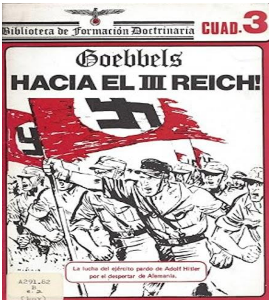
Ilustración 2. Revista Milicia 7